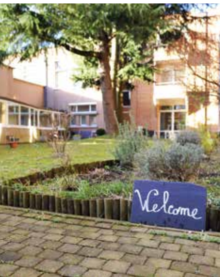
Ontspannen in de binnentuinen of in de biljartzaal

De Residentie Arcadia biedt u een gezellige leefomgeving. Er zijn verschillende ruimtes die voor iedereen toegankelijk zijn: een ruime en moderne cafetaria die uitgaat op de tuinen, een feestzaal waar we verschillende voorstellingen en animaties organiseren, een bibliotheekruimte met biljarttafel, een computerzaal, binnentuinen en terrassen die uitnodigen tot rust en ontspanning.