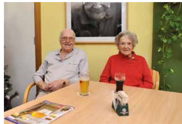
Rustig iets drinken in de cafetaria