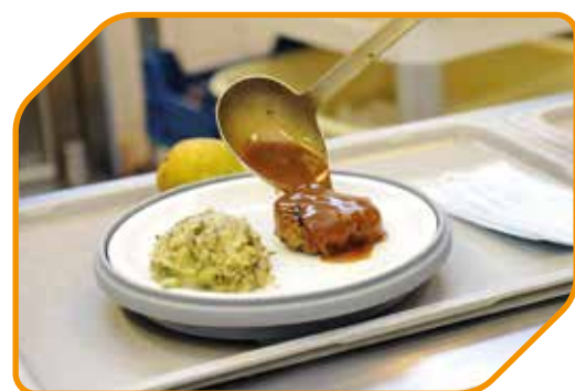
Gevarieerde en lekkere maaltijden, ter plaatse bereid volgens strikte hygiënevoorschriften