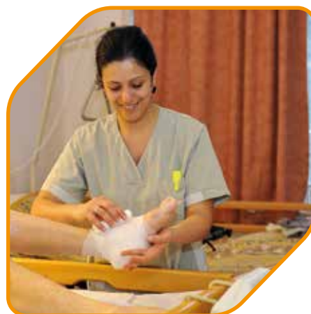
Een professioneel en hartelijk team verleent kwaliteitsvolle zorgen, met respect voor uw fysieke en psychologische integriteit