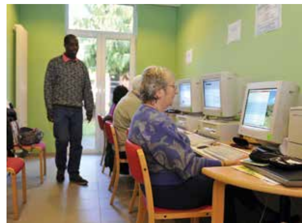
Een computerzaal met internetverbinding