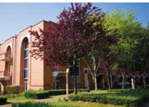
Een oase van rust in de stad waar u zich veilig en geborgen kan voelen

Het rust- en verzorgingstehuis ligt vlak bij het Scheutbospark in een rustige en groene omgeving. Een oase van rust in de stad waar u zich veilig en geborgen kan voelen.