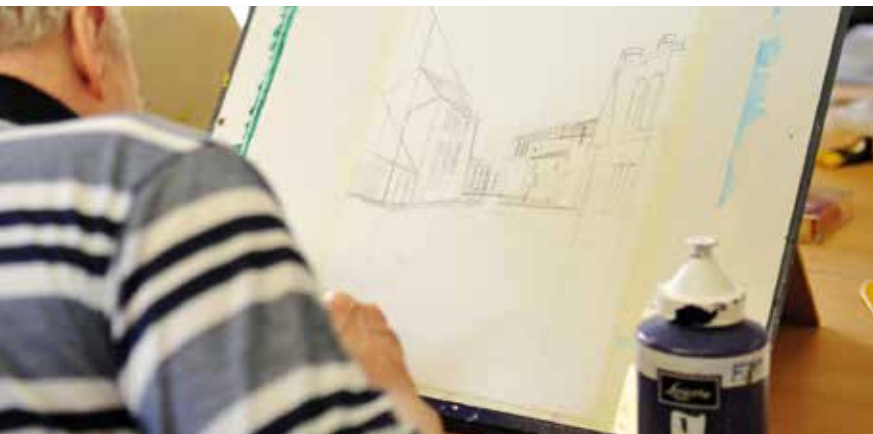
Gevarieerde activiteiten in functie van uw wensen en uw fysieke conditie