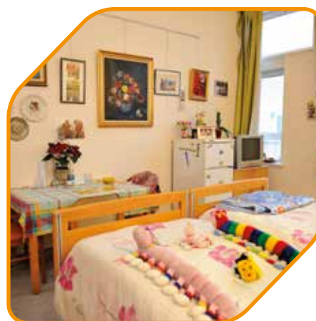
Een een- of tweepersoonskamer: een formule aangepast aan uw financiële situatie