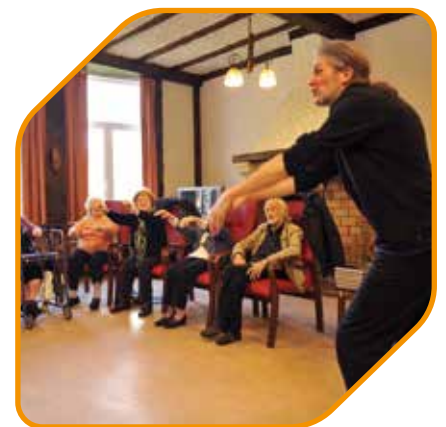
Het koor van de residenten, onder de leiding van een professionele dirigent, treedt elk jaar op met andere koren in de Koninklijke Muntscouwburg