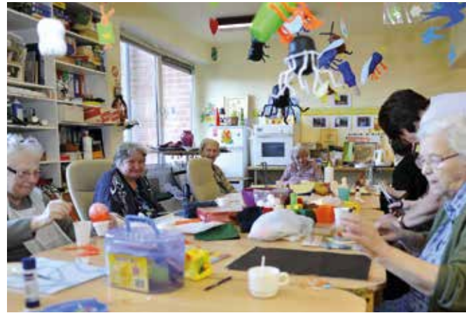
Animatie en activiteiten om te ontspannen, uw zelfstandigheid te behouden en sociale contacten te bevorderen